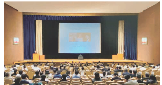
2021年明治神宮開館 公開プレゼンテーションの様子