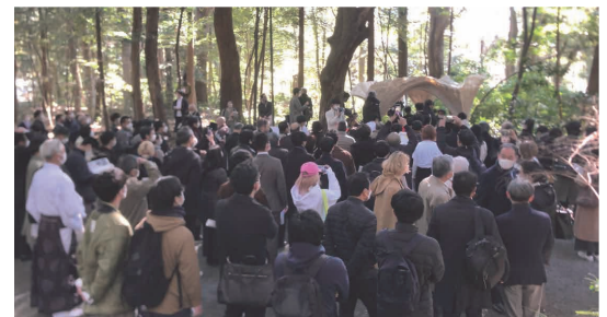
2021年明治神宮開館 公開プレゼンテーションの様子