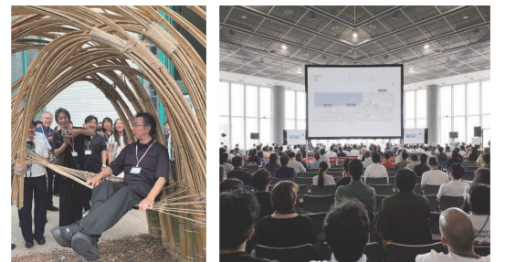
2025年開催 作品視察の様子